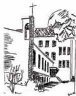
Sankt Antonius Frankenberg