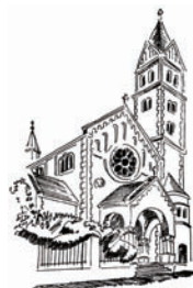
Sankt Joseph Chemnitz